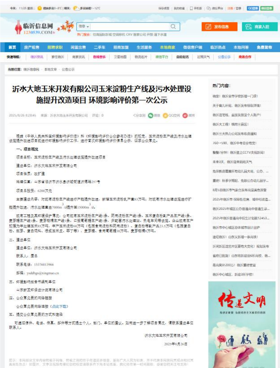
附图 1 项目环评第一次公示（网站公示）