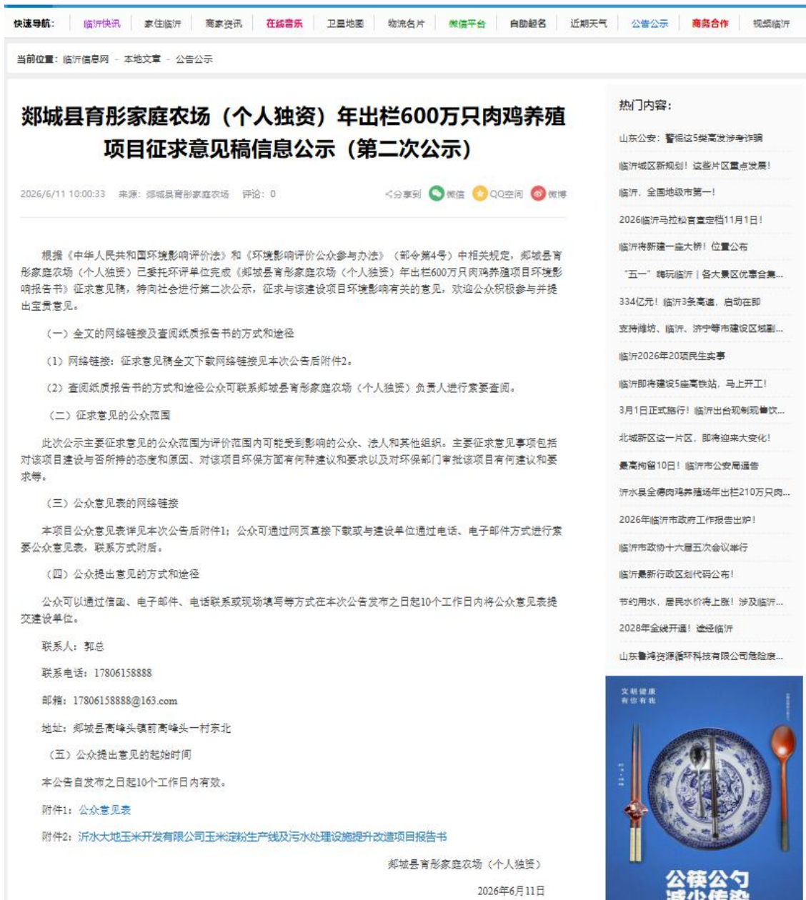
附图2 项目环评第二次公示（网站公示）