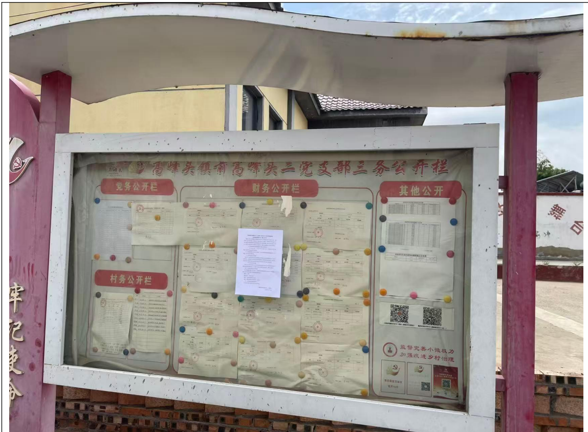
前高峰头二村公示