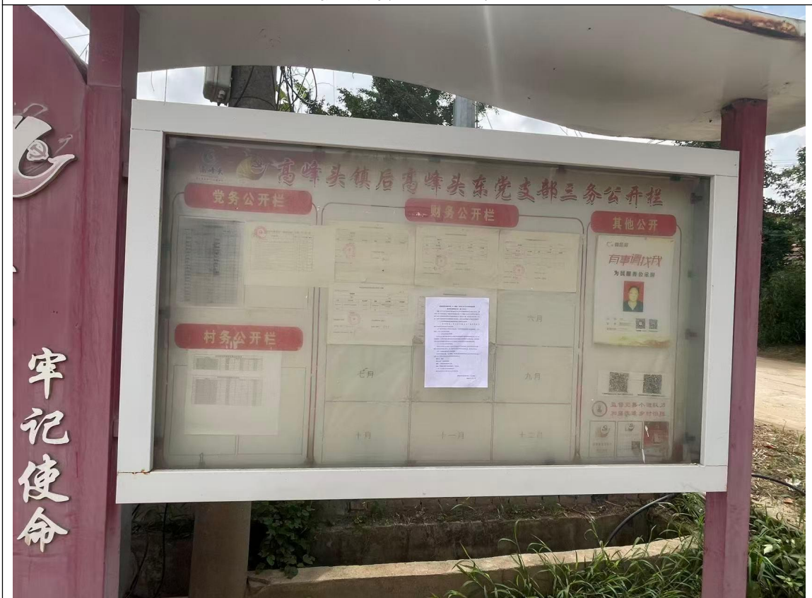
后高峰头东村公示