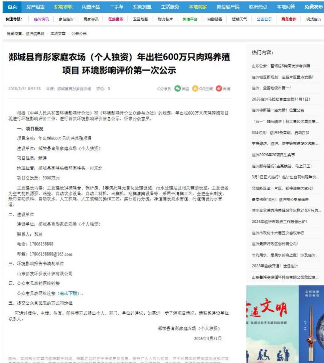
附图 1 项目环评第一次公示（网站公示）